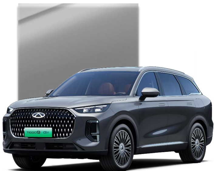
Universe Gray (UEM)