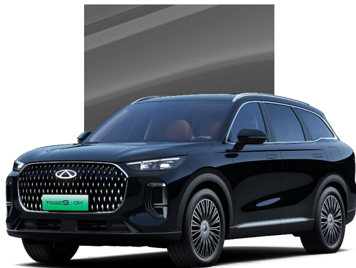
Pine Black (CLM)