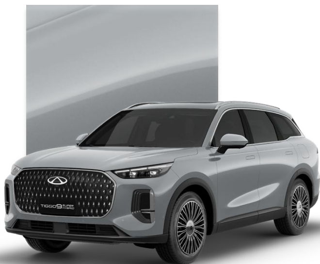
Tech Gray (GXM)